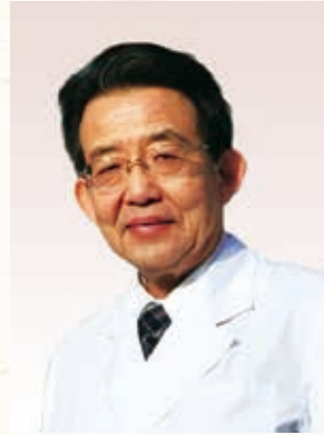
岡谷市民病院 事業管理者・病院長